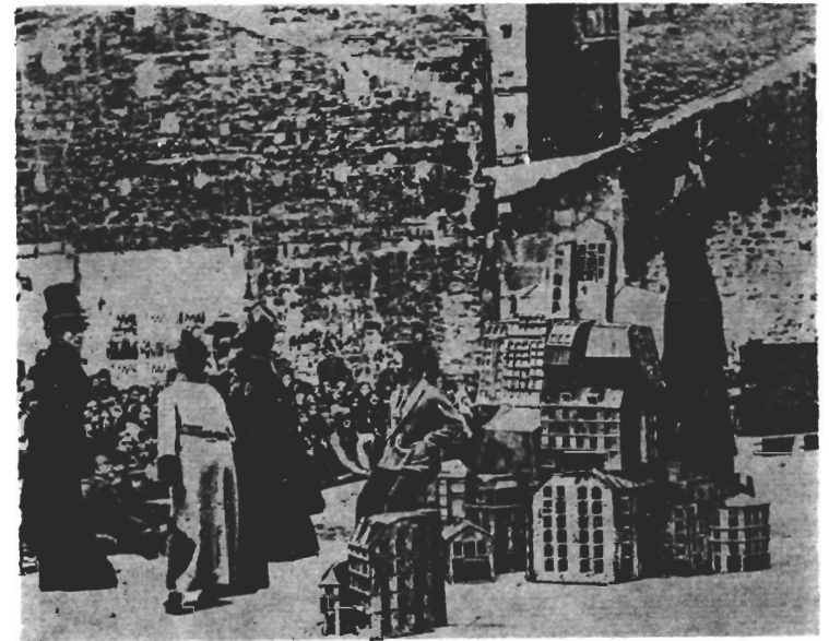
ΑΓΩΝΙΖΟΜΕΝΟ ΘΕΑΤΡΟ ΣΤΟ ΔΡΟΜΟ

Τέλος, θέτει τὸ ἐρώτημα μιᾶς σύγχρονης λαϊκῆς Ἀρχιτεκτονι-